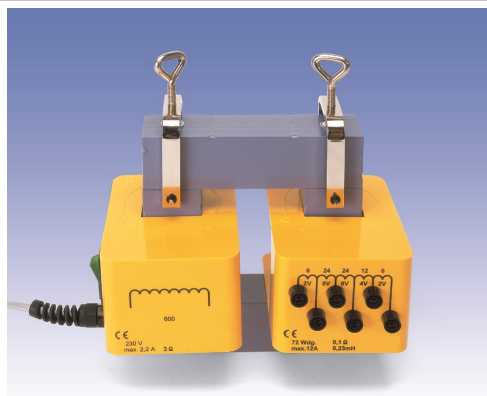
Fig.1 Transformador de montagem