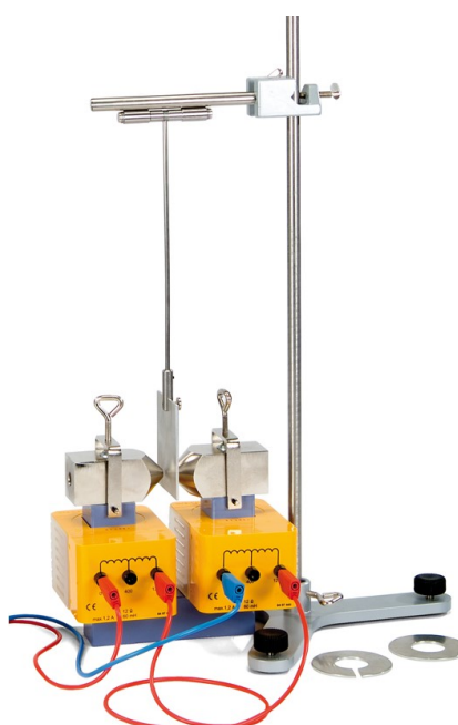
Fig. 2 Pêndulo de Waltenhof