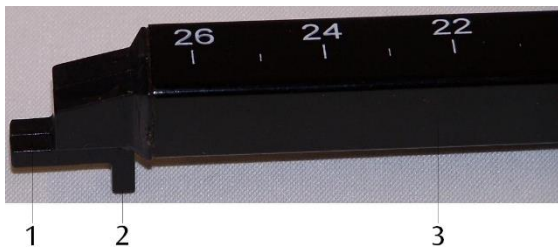
Magnetfeldsonde: 1 tangentielle Hallsonde (z-Richtung), 2 axiale Hallsonde (x-Richtung), 3 Träger