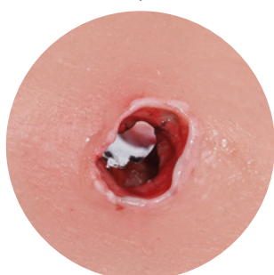
Сквозная огнестрельная рана входное отверстие