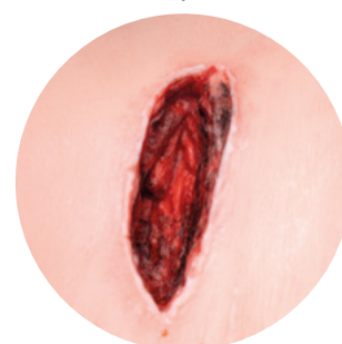
Глубокая рваная рана