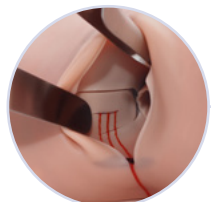
Sangramento vaginal Sutura de lacerações vaginais