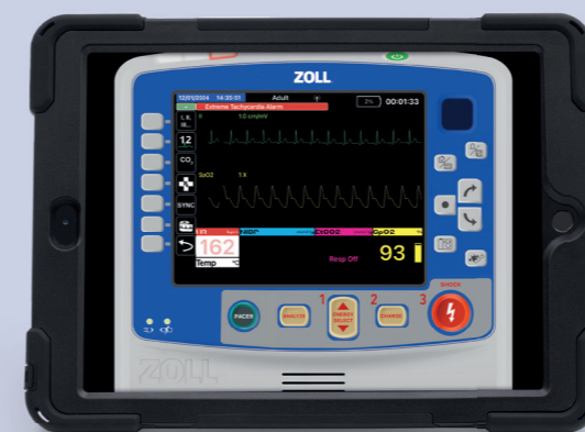
Monitordarstellung ohne SimConnect

SimConnect ist die unverzichtbare Ergänzung Ihres REALITi 360 Systems im Klassenzimmer und bei anspruchsvollen Vor-Ort-Situationen.