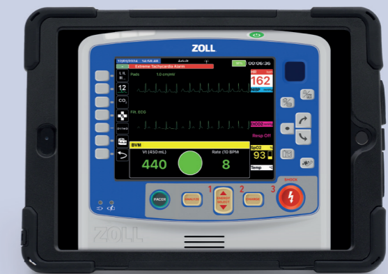
Monitordarstellung mit SimConnect

Verbessern Sie Ihr Erlebnis mit REALITi 360: Sie sind an einer Erweiterung Ihres REALITi 360 Systems interessiert? Setzen Sie sich für eine persönliche Produktvorführung mit unserem Team in Verbindung.