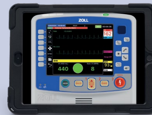
Treinamento usando SimConnect com qualquer manequim

Eleve sua Experiência com o REALITi 360: Intrigado com o potencial transformador do SimConnect? Entre em contato com nossa equipe para uma demonstração pessoal do produto.