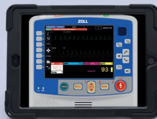
Treinamento sem SimConnect

Perfeitamente projetado para treinamento de socorristas e paramédicos, enfatizando técnicas de intervenção médicas rápidas.