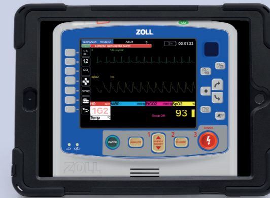
SimConnect olmadan eğitim

Hızlı tıbbi müdahale tekniklerini vurgular, ilk müdahale ekipleri ve paramedik eğitimi için mükemmel bir şekilde tasarlanmıştır.