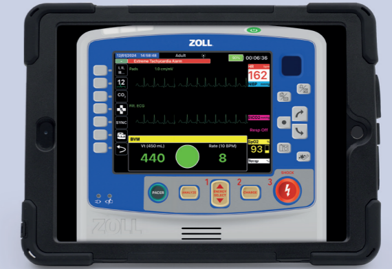
Herhangi bir Manken ile SimConnect kullanarak eğitim

REALTi 360 Deneyiminizi Geliştirin: SimConnect'in potansiyeli ilginizi çekti mi? Kişisel ürün tanıtımı için ekibimizle iletişime geçin.