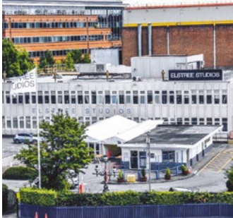
Elstree Film Studios

Das 2017 gegründete Unternehmen Lifecast Body Simulation hat eine Reihe hochpräziser und naturgetreuer medizinischer Simulationspuppen entwickelt, die die Art und Weise, wie medizinische Simulation und Ausbildung vermittelt und aufgenommen werden, verändern.