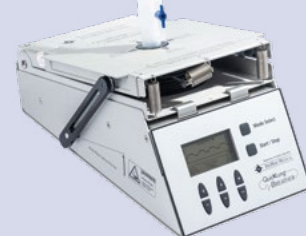
QuickLung Breather | 1025192*

* Доступен также в педиатрической версии