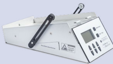
Опция QuickLung Breather | 1025207