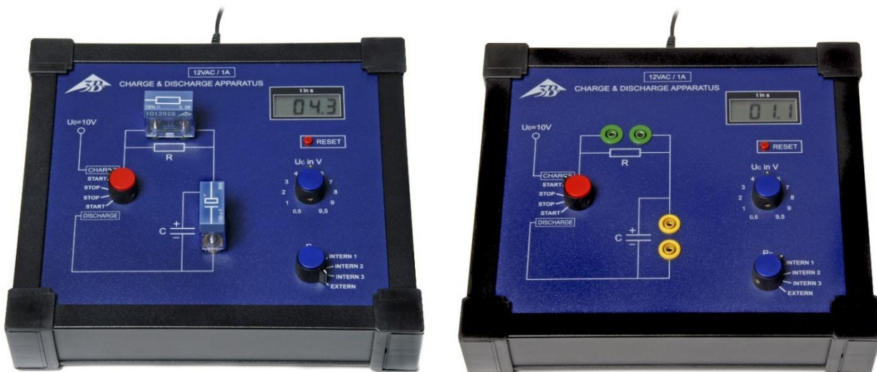
Fig. 1: Apparecchio di carica e scarica in funzione con coppia condensatore/resistenza esterna (sinistra) e interna (destra)